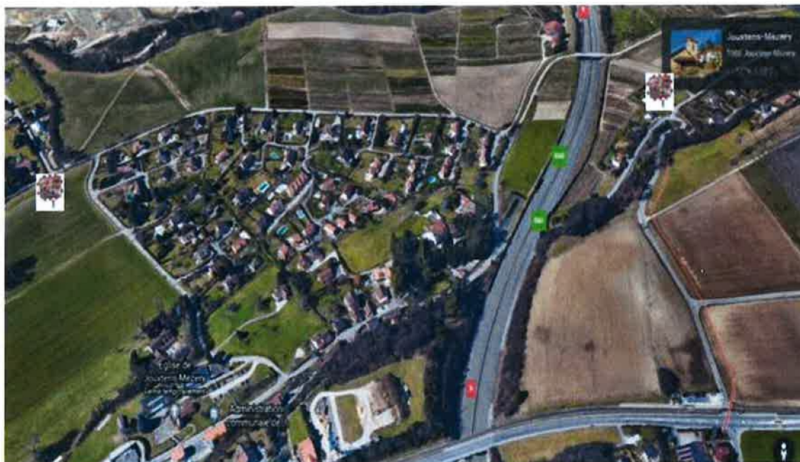
Croisements : ch. de Crissier – Boracles et Lussex – la Roche

De même la création d'une « zone 20 » aux alentours de l'école, où les piétons ont la priorité, permettrait une dépose sécurisé des enfants ainsi qu'une traversée plus sûre du chemin de Beau-Cèdre. Les exemples (positifs) sont : le centre ville à Cheseaux ainsi que la place de la Gare à Renens.