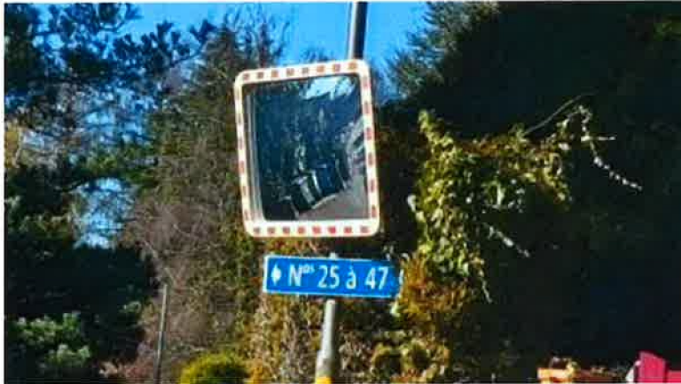
Miroir - chemin de la Cure