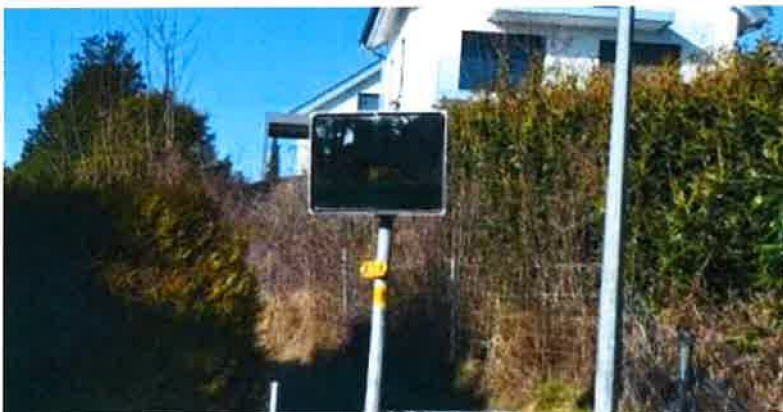
Miroir - chemin de Praz-Fornay