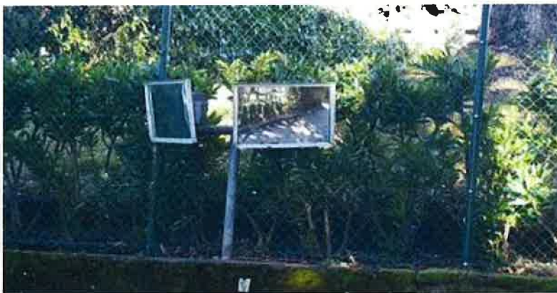
Miroirs - chemin de la Cure (2)