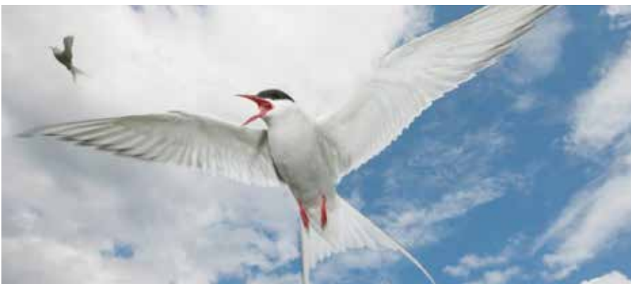
La sterne arctique est l'oiseau migrateur qui parcourt la plus longue distance

Enfin, il reste l'orientation par rapport au champ magnétique terrestre. Les chercheurs ont détecté de minuscules cristaux de magnétite le long de la zone olfactive dans le