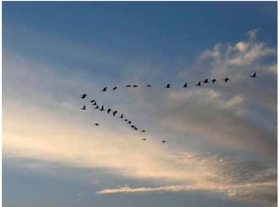
Quand l'hiver approche, les oiseaux migrateurs se dirigent vers le Sud. Comme s'ils avaient une boussole intégrée.

Chaque année, l'automne voit partir nos hirondelles ou les cigognes blanches qui parcourent des milliers de kilomètres pour rejoindre leurs quartiers d'hivers africains. Elles ne descendent pas en ligne droite vers le Sud, mais traversent la Méditerranée par l'Espagne et le détroit de Gibraltar. Les trajectoires de leurs cousines de l'est de l'Europe sont encore plus compliquées en direction de l'Afrique du Sud, en passant par le canal de Suez, la péninsule Arabique, la Turquie et le détroit du Bosphore. Pendant ce temps-là, la sterne arctique est en plein tour du monde, longeant du nord au sud les côtes africaines, puis remontant par l'Amérique du Sud, afin de rester le plus longtemps possible au soleil. De toute évidence, les oiseaux migrateurs ne perdent donc jamais le nord !