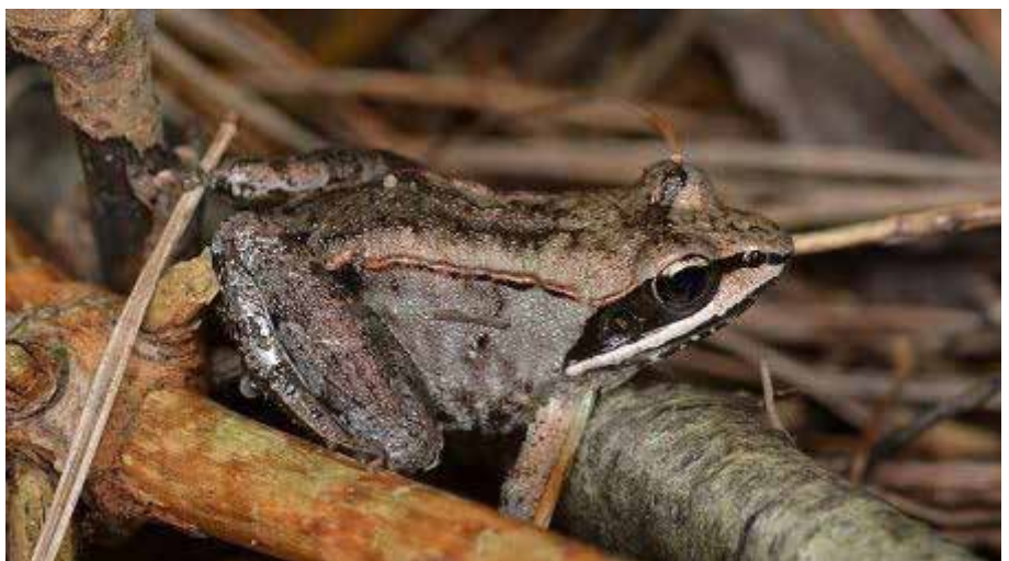
La grenouille des bois d'Alaska est capable de résister à une congélation.