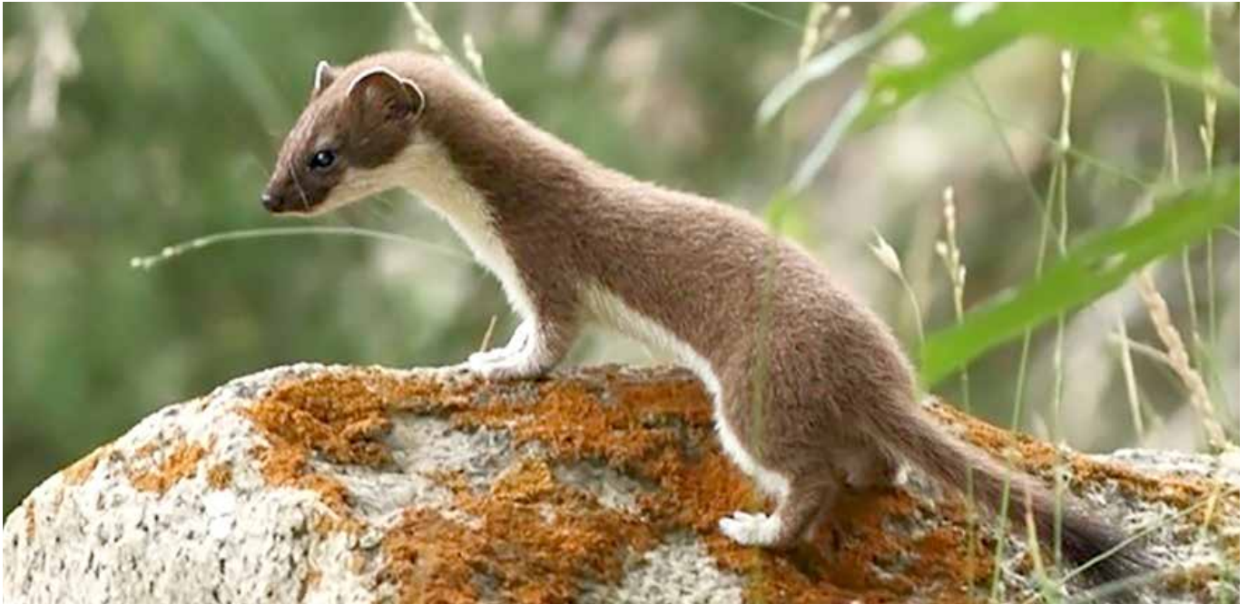
Hermine en été