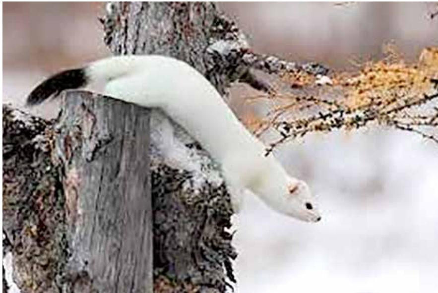
Hermine en hiver