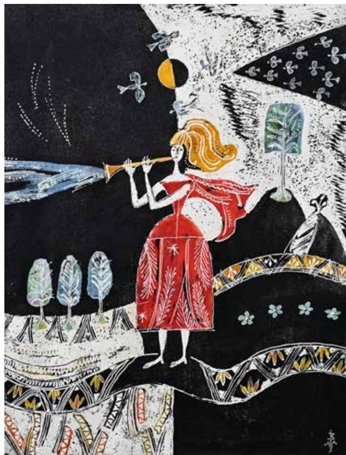
L'annonciatrice du printemps