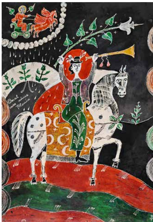
Le Faiseur de pluie