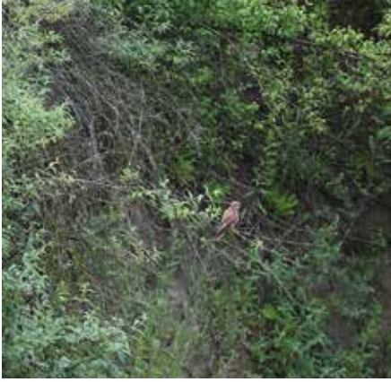
Autour d'Europe à l'affût à Penthaz