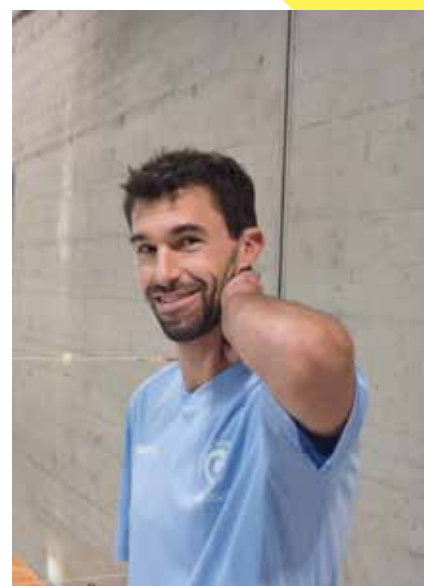
Le nouveau président arborant le maillot des 30 ans de la SSJM