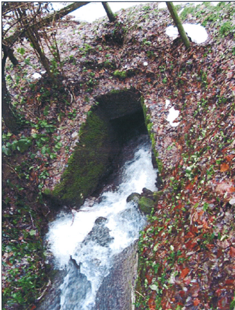
Canalisation du ruisseau de Sous-Lavaux sous le ch. du Taulard

relatif à la demande d'un crédit de CHF 214'000.00 pour augmenter la capacité du ruisseau « Sous-Lavaux » sous le chemin du Taulard et 40 m' en aval. Demande de crédit.