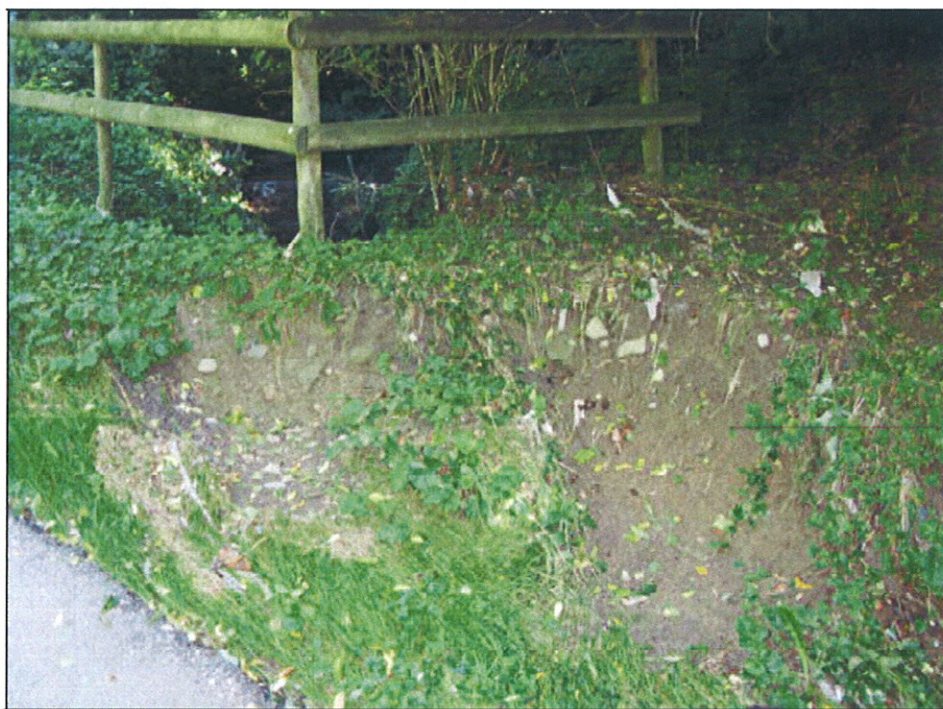
Erosion au niveau du ch. du Taulard

Le passage sous le chemin du Taulard à Jouxkens-Mézery est sous-dimensionné à l'état actuel. La photo ci-dessous montre que le ruisseau de Sous-Lavaux passe régulièrement par-dessus le chemin d'accès et érode le terrain en bordure de route.