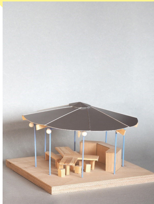
Maquette du « kiosque » avec ses meubles